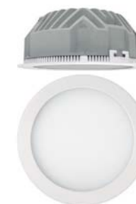
Aircorn Supra LED