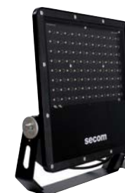
Protek Q2 LED