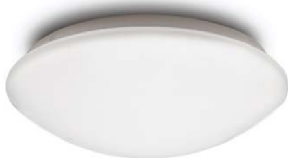
Ove LED superficie / surface / 18w

Incluye lámparas LED / Includes LED lamp