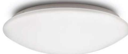
Ove LED superficie / surface / 24w

Incluye lámparas LED / Includes LED lamp