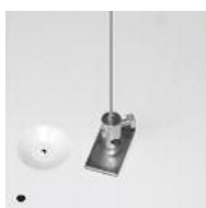
1215. Tensor de seguridad SCB/SCB safety cable