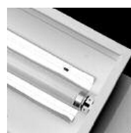
1213. Recuperador de flujo/Flow recuperator

GARANTÍA / GUARANTEE: 2 años observando las condiciones de venta de nuestro Catálogo General / 2 years watching to the conditions of sales of our General Catalog.