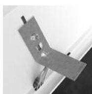
1214 Juego de cuatro garras/Four clutches set